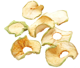
lii traañsh di pom shesh