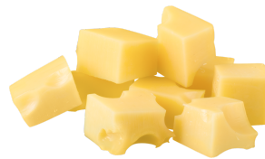
lii morsoo di framaezh