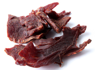
lii morsoo la vyaañd shesh

Keekway ee-nohtee-miichiyeen? Ki-daweeyihten chiiñ lii morsoo di framaezh oo baeñ lii morsoo di karot ? →