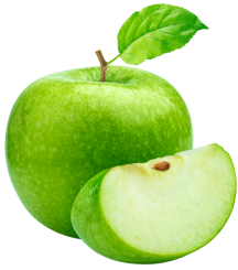
en traañsh di pom