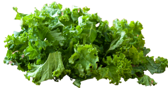
lii morsoo di fy