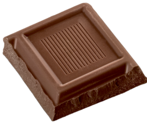
aeñ morsoo di shaakwalaa