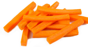
lii morsoo di karot